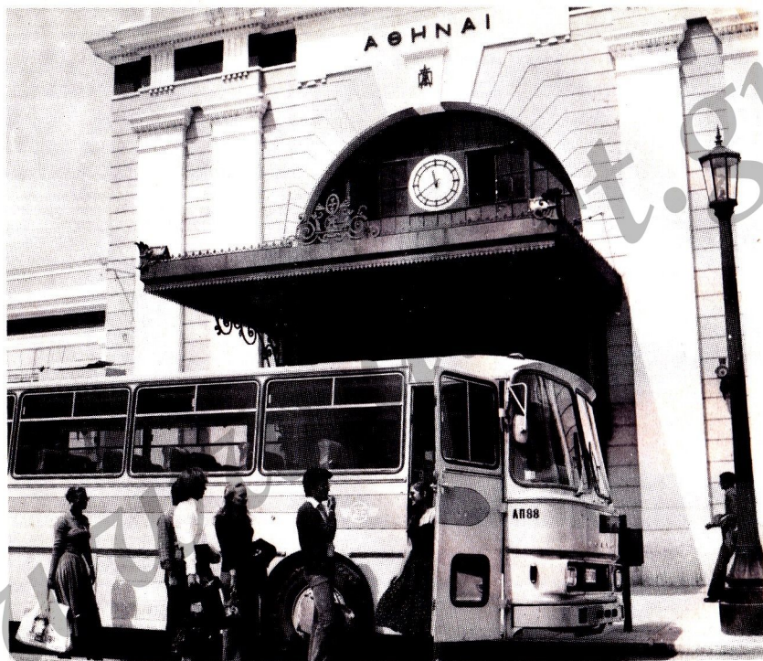
Ο ΟΣΕ έχει λεωφορειακές γραμμές από και για εξωτερικό